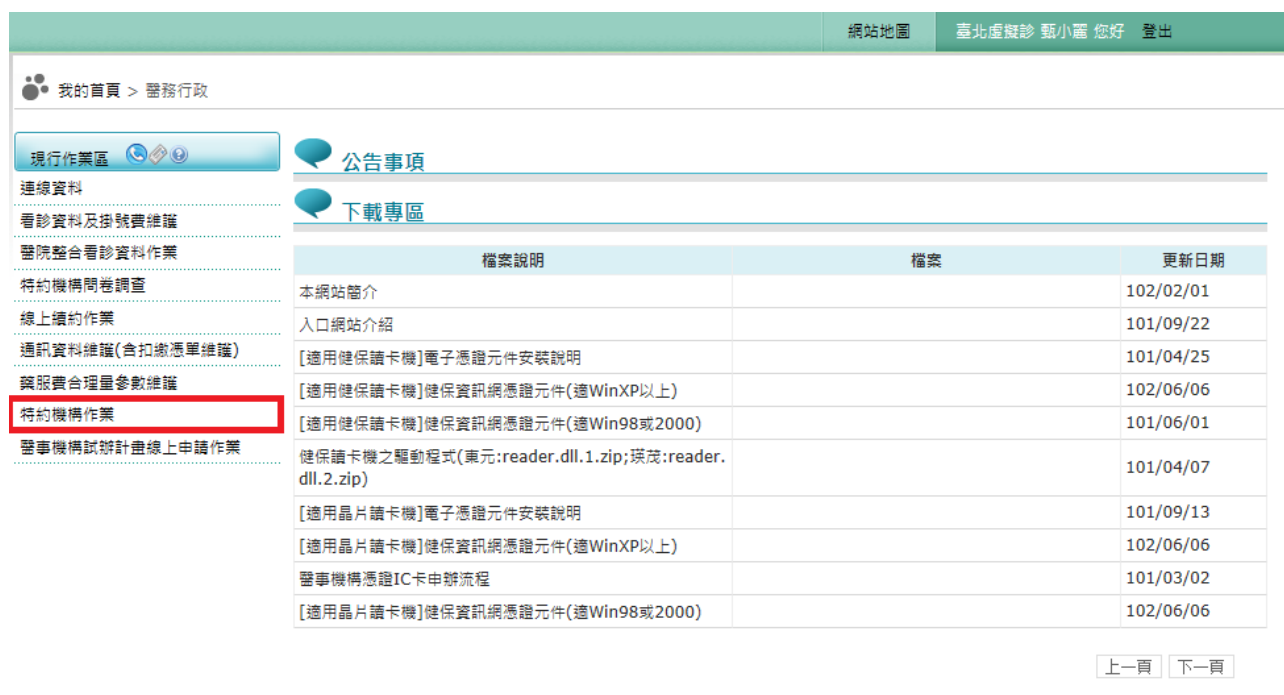
圖 2 從現行作業區點選特約機構作業