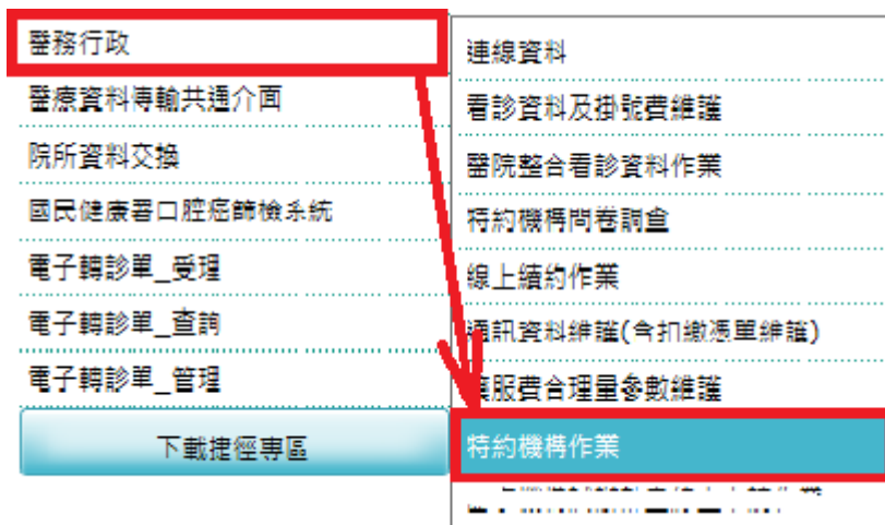
圖 3 從醫務行政點選特約機構作業