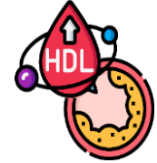
高密度脂蛋白 膽固醇值(HDL)